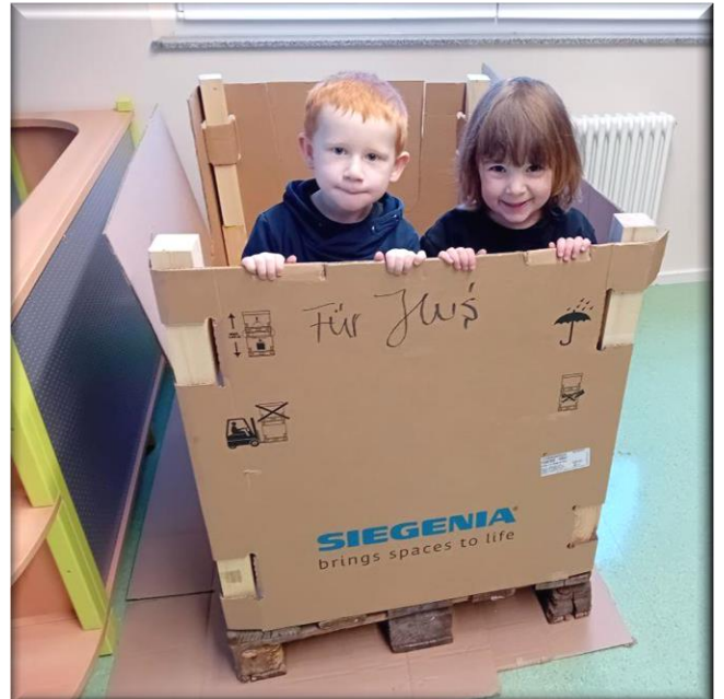
..... und austesten!