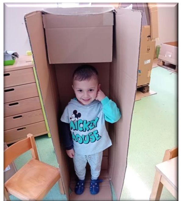
.... Der Chef steht im Schrank,