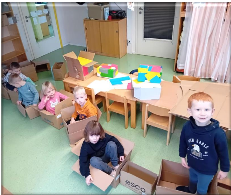
Teamsitzung durchführen, ....