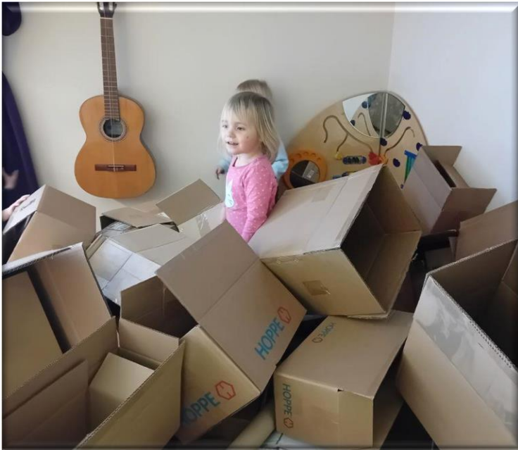
Erst einmal Material sichten....

Auch in diesem Jahr waren nach der Grundreinigung unsere Spielsachen weg! Wollten uns die Erzieherinnen ärgern? Das klappte mit uns nicht!. Denn an tollen Ideen mangelte es uns nicht!