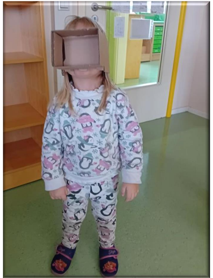
.... Oder VR – Brille?