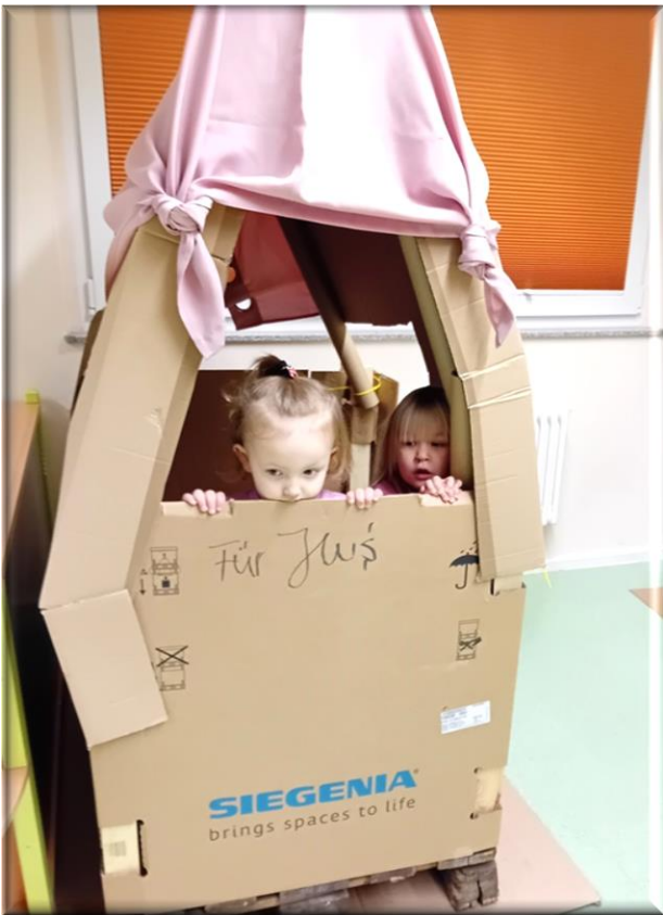
Es entstand ein schönes Haus...