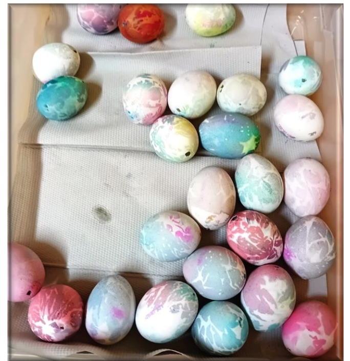
Mit den Kunstwerken schmückten die „Wackelzähne“ einen Baum vor der „Freiwilligen Feuerwehr Hohenmölsen“