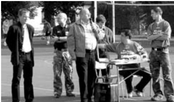
Als Ehrengäste wurden begrüßt: Bürgermeister Hans Dieter von Fintel und Staatssekretär Rüdiger Erben

Auch die 2. Auflage am 17.09.2006 war ein voller Erfolg. Mehr als 250 Sportfreunde waren zumeist aktiv dabei.