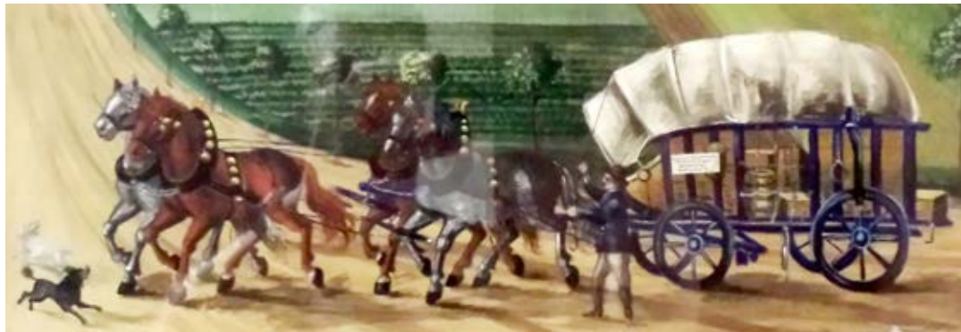
Ausschnitt aus dem Gemälde „Dem Fuhrwerksverein zu Hohenmölsen 1884“ (im Rathaus HHM)

die erste solide Anlage vermindert, oder doch auf lange Zeit hinausgesetzt werden können, so muß bey dem tüchtigsten Straßenbau Anlage, Unterhaltung und Reparatur ununterbrochen auf einander folgen, wo nicht zu deßen Anlegung verwendeten großen Kosten in kurzer Zeit gänzlich verlohren gehen sollen.“