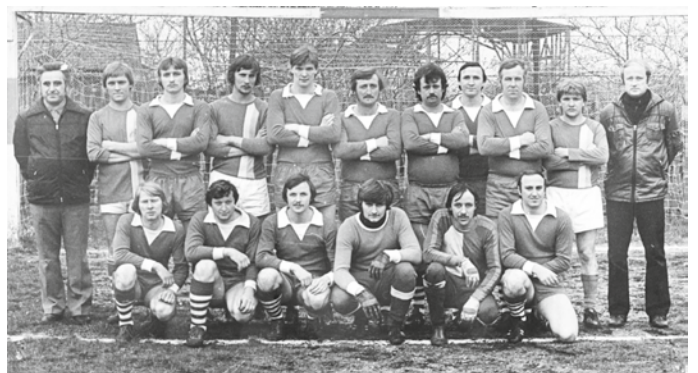
Aktivist Jaucha I, Aufsteiger zur Bezirksklasse 1979/80