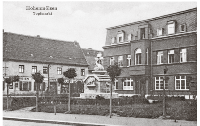
Altmarkt (Topfmarkt) mit Denkmal und Amtsgericht um 1930

Für den Betrieb als Gericht führt die Stadt notwendige Umbauarbeiten wie Schaffung eines Gerichtssaales in der 1. Etage und einer Haftzelle für zwei Personen im Hof durch. Ladentür und Schaufenster zur Marienstraße werden zugemauert, vor allem wird der äussere Zierrat der „Neo-Baustil-Elemente“ entfernt; das Haus erhält ein modernes Äußeres. Gleichzeitig werden die Kastanien um das Denkmal gefällt und die Anlage parkähnlich gestaltet.