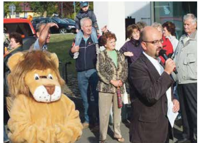
Eröffnung des 19. Kinder-, Stadt- und Vereinsfestes am 3. Oktober 2012