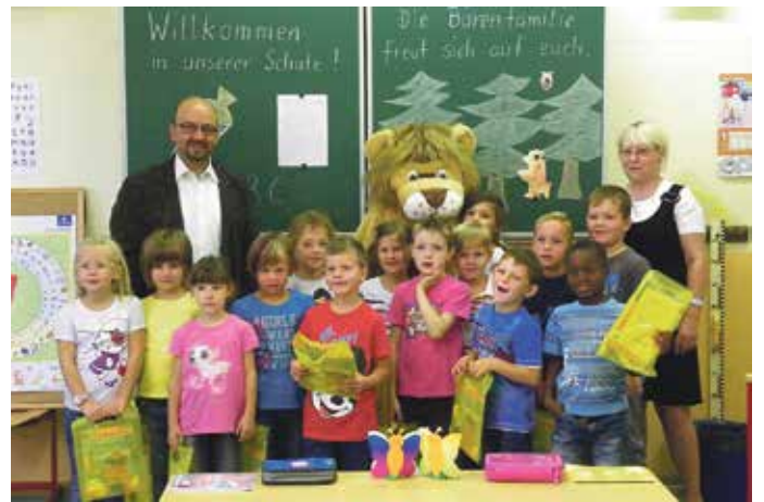
Lesebeutelübergabe an der GS Granschütz

Und hier ein paar tierisch gute Fotos von Leo