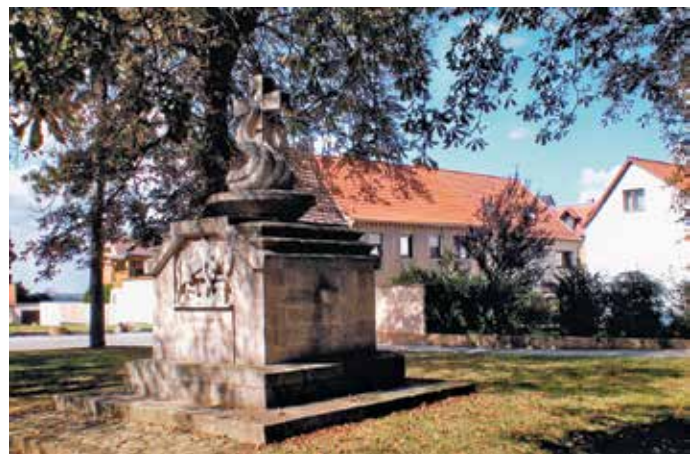
Ansicht vom annähernd gleichen Blickwinkel 2012

Für das Haus Altmarkt 17/18 „Kaufhaus-Amtsgericht-Kreisleitung“ findet sich keine Verwendung mehr und auch kein Käufer. So wird es Anfang 2006 mit Mitteln der Innenstadtsanierung abgebrochen, die Fläche eingeebnet und vom Besitzer des Nachbargrundstückes in der Marienstrasse erworben und in einen Hausgarten umgestaltet.