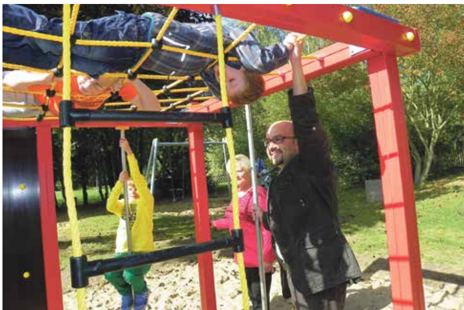
Bild oben: Neues Spielgerät auf dem öffentlichen Spielplatz Birkenhang in Taucha