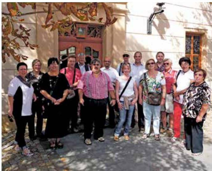
Besuch aus unserer Partnerstadt Bad Friedrichshall

Samstags stand ein Besuch in Leipzig an, aber pünktlich zur „Hohenmölsener Schlacht“ waren alle wieder zum Mittelaltertrubel versammelt.