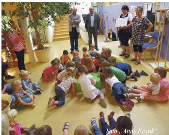
Kita „Anne Frank“