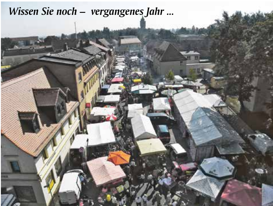
Wissen Sie noch – vergangenes Jahr ...

... freuen Sie sich mit uns auf den Herbstmarkt 2012.