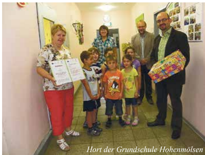
Hort der Grundschule Hohenmölsen

In diesem Zusammenhang möchten wir darauf verweisen, dass die Kindertagesstätte „Kinderland-Sonnenschein“ und der Hort der Grundschule Hohenmölsen ebenfalls dieses Zertifikat erhalten haben.