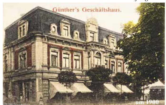
Archivrecherche und Text: Rolf Kirsten Bildbearbeitung: Brasack-Drucksachen