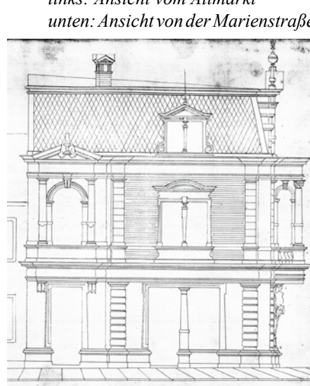
links: Ansicht vom Altmarkt unten: Ansicht von der Marienstraße

die Wohnungen in dem neuen Wohnhause drei Monate nach erfolgter Abnahme des Rohbaues – also am 23. October – bezogen werden; wir setzen jedoch voraus, daß Sie die Austrocknung der Wände durch beständiges Heizen der schon aufgestellten Öfen möglichst zu beschleunigen suchen.“