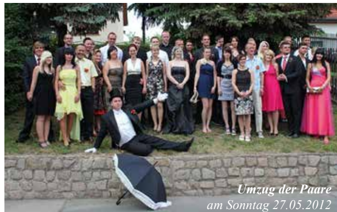
Umzug der Paare am Sonntag 27.05.2012