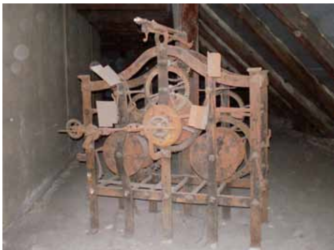
Das Uhrwerk von 1837. Bei der Besichtigung wurde der Entschluss gefasst, das Werk für das künftige Stadtmuseum herzurichten.

Gehorsamst Schlegel, Schlosser und Großuhrmacher“