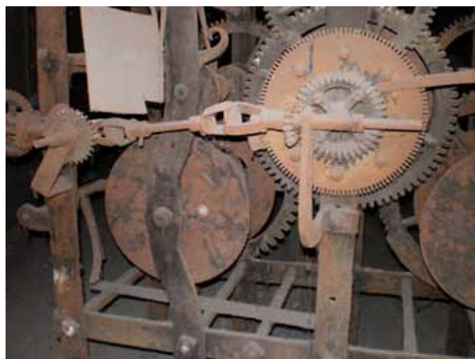
Detailaufnahme – Zeigerantrieb

Nachdem auch noch der Klempner Pfeifer aus Weißenfels kritische Stellen, an denen Wasser eindringen könnte, mit Zinklech beschlagen hatte, aber wegen der schwierigen Arbeit 12 Thaler dafür verlangte, stand dem Einbau der Uhr nichts mehr im Wege.