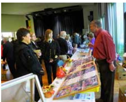
Präsentationen der Vereine im Bürgerhaus