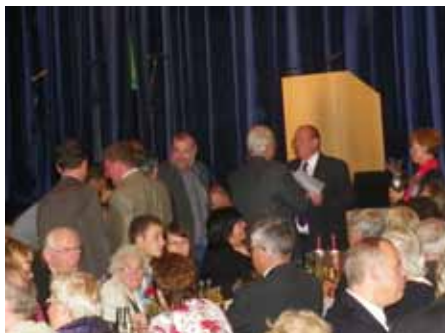
Eintrag in das Ehrenbuch unserer Stadt

Ein umfangreiches Programm mit vielen Höhepunkten, perfekter Organisation, gut gelaunten Gästen und Gastgebern sowie tolles Wetter ließen die Feierlichkeiten zum 20-jährigen Bestehen der Städtepartnerschaft zwischen Hohenmölsen und Bad Friedrichshall, verbunden mit dem alljährlich stattfindenden Kinder-, Stadt- und Vereinsfest, zu einem Wochenende der Superlative werden.