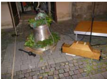
Die neue Glocke