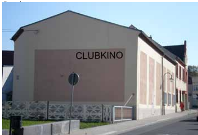
Fotomontage – wer hat noch ein Originalfoto?

Eine nochmalige Nutzung für einige Jahre erfuhren die Räume als Videothek, untergebracht im kleinen Saal und dem Studiokino. Dieses Unternehmen endete 2004 in der Insolvenz, aus der es von Privat erworben wurde. Von diesem erfolgte in Vorbereitung der 925-Jahrfeier der Stadt die Renovierung der Fassaden und die Instandsetzung des Daches. Seitdem ist es ruhig geworden um das Kino. Von privater Seite gibt es aber Ideen für eventuelle Nutzungen. Immerhin lässt sich der Kinovorhang auch heute noch auf Knopfdruck öffnen und schließen, nur der