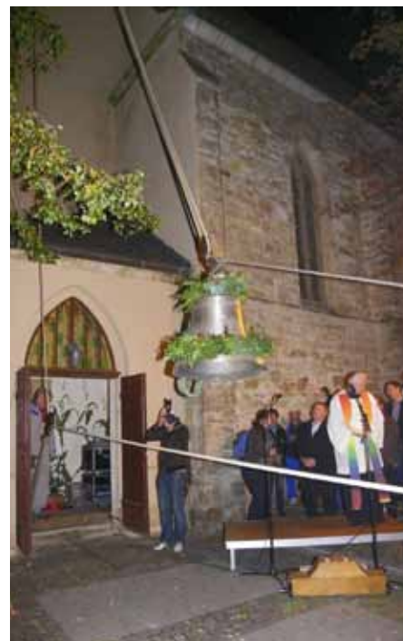
Die Glocke wird hochgezogen