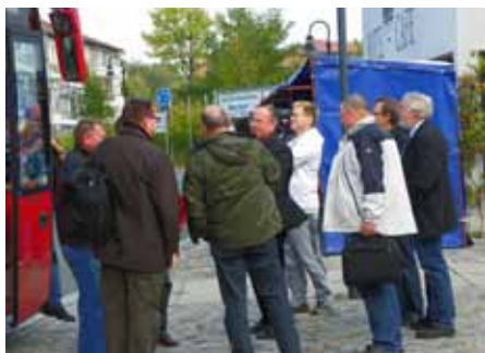
Ankunft und Begrüßung