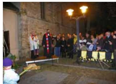
Weihe der 5. Glocke im Geläut von St. Peter