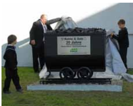
Enthüllung des Gedenk-Hunts