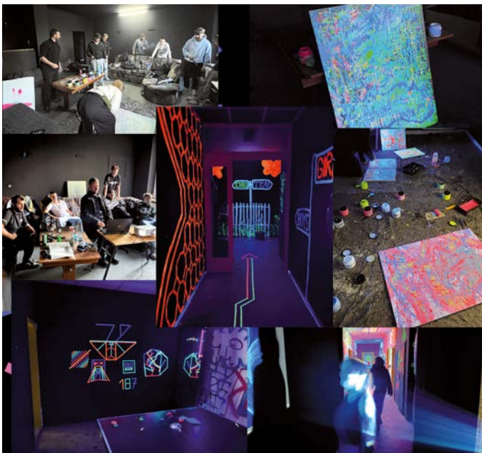
Collage: Impressionen aus den Kreativ-Workshops des Visions e.V., von UV-Klebeband-Kunst über Raumgestaltung bis Action Painting.

Das Projekt wurde gefördert durch die Deutsche Stiftung für Engagement und Ehrenamt (DSEE) im Rahmen des Mikroförderprogramms. Der Visions e.V. bedankt sich herzlich für die Unterstützung.