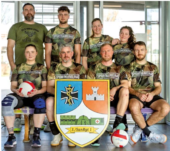
Mannschaft der Patenkompanie

Am 28. Februar 2026 nahm wiederholt die Mannschaft der 3. Kompanie des Sanitätsregimentes 1 am jährlich stattfindenden Volleyballturnier, um den „Pokal des Bürgermeisters“ in Hohenmölsen teil. Insgesamt stellten sich zwölf Teams der sportlichen Herausforderung, und wir konnten dabei einen erfreulichen Erfolg verbuchen: Mit dem achten Platz gelang eine deutliche Steigerung im Vergleich zum Vorjahr.