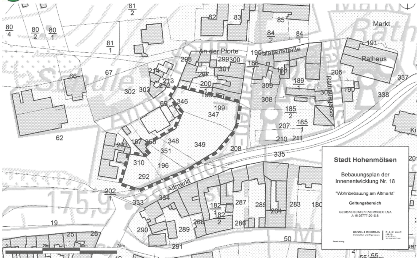
Anlage: Geltungsbereich Bebauungsplan der Innenentwicklung Nr. 18 „Wohnbebauung am Altmarkt“