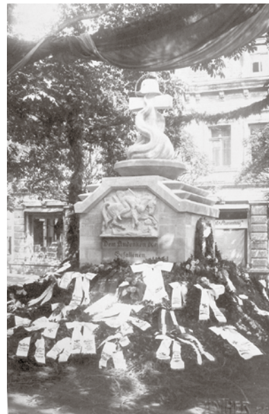
Bild links: Einweihungsfeier des Denkmals am 29.08.1926

wenn nicht ein entsprechendes Haus als Amtsgericht zur Verfügung gestellt wird. Also wird aus Günthers Kaufhaus das Amtsgericht.